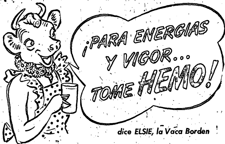
dice ELSIE, la Vaca Borden

Club de Vestidos, Trabajos Garantizados GÓMEZ y PORTO — Sastres Asociados OCUPENOS Y QUEDARA SATISFECHO Calle 12 de Octubre, Casa 8, Apartamento No. 2